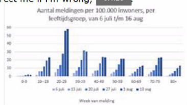
*figuur 7. Aantal meldingen per 100.000 inwoners per leeftijdsgroep in de afgelopen 6 weken.

Maandag is het R-team alleen [REDACTED] en ze ziet zo direct niet hoe ze met dezelfde opmaak dat kan reproduceren in R (correct me if i'm wrong, [REDACTED])